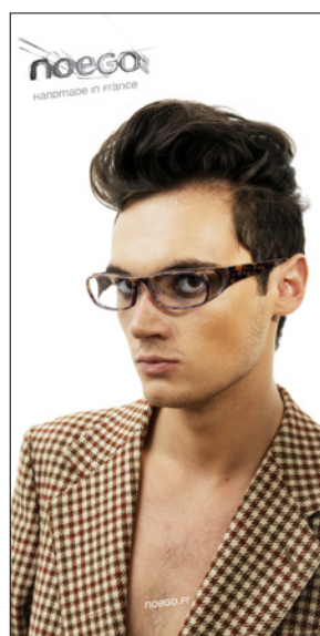
POSTER 30 x 60 cm VERSO BACK