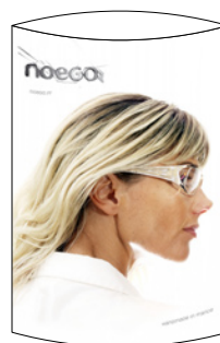
TOTEM V 21 x 30 cm RECTO FRONT