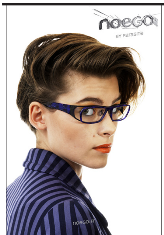
kakemono 60 x 90 cm