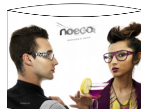
TOTEM H 30 x 21 cm RECTO FRONT