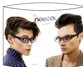
TOTEM H 30 x 21 cm VERSO BACK