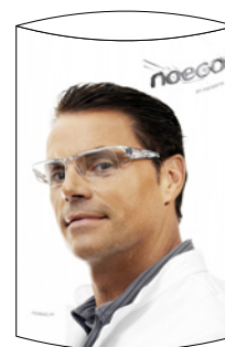
TOTEM V 21 x 30 cm VERSO BACK