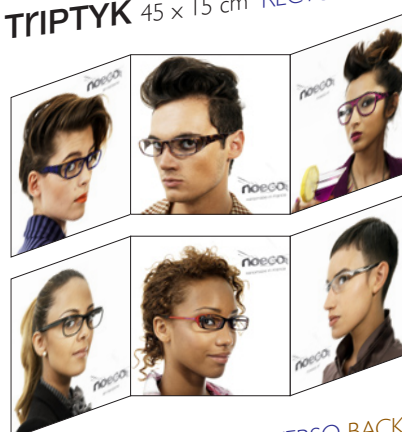
TRIPTYK 45 x 15 cm VERSO BACK