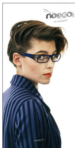
POSTER 30 x 60 cm RECTO FRONT